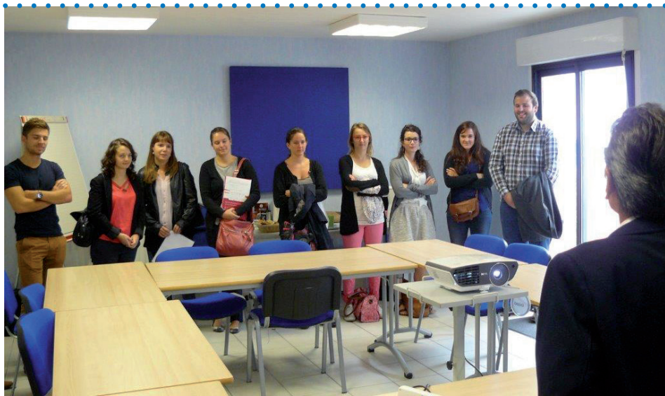
Intronisation des nouveaux diplômés 2015.